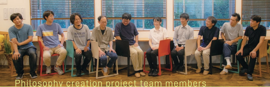
Philosophy creation project team members