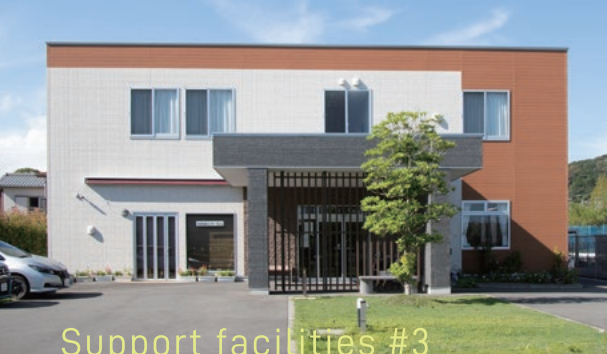
Support facilities #3