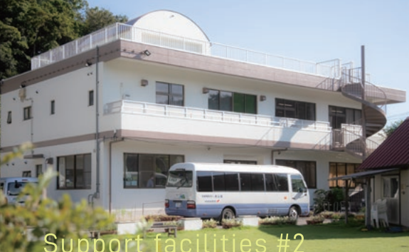
Support facilities #2