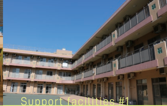
Support facilities #1